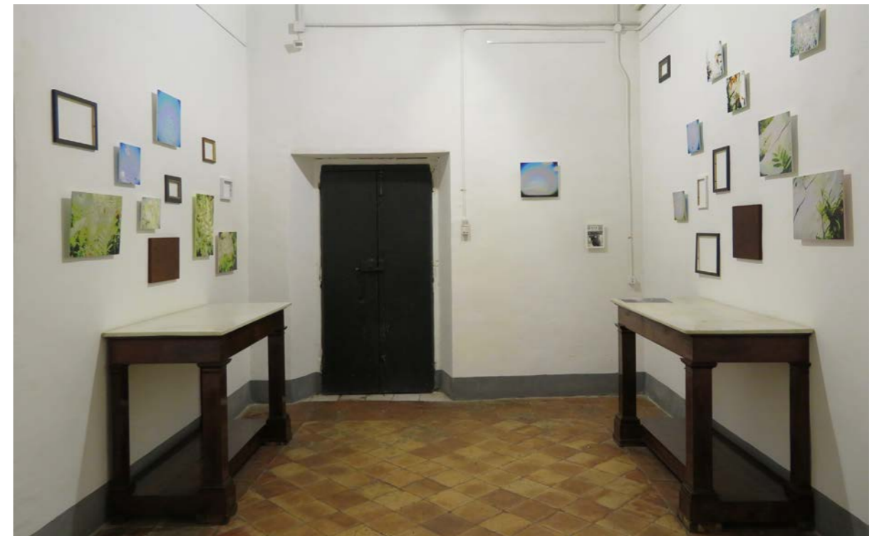
「LATITUDO 36 - 40」 Villa di Donato, Naples, Italy