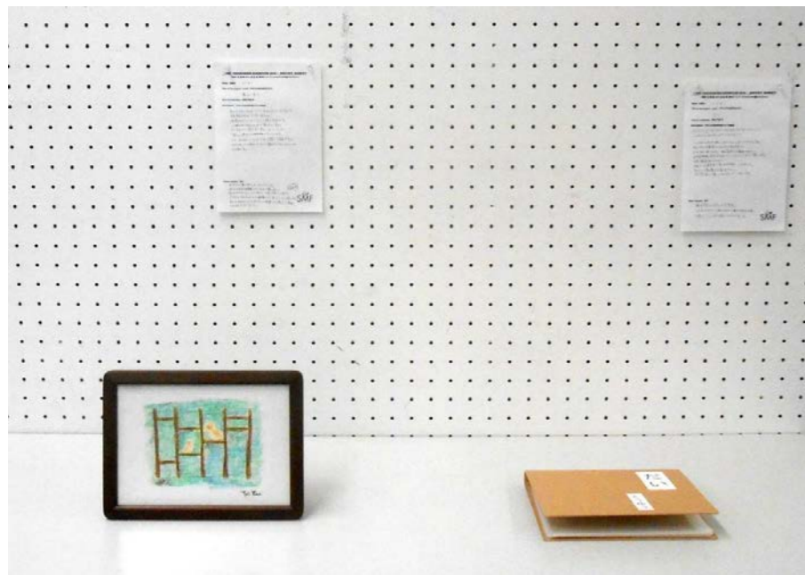
だい (右) 2017 鳥が会う (左) 2017

どちらも描画にはクレヨンを使用。 ただし「鳥が会う」は原画 「だい」はPCにて加工し、印刷したもの。