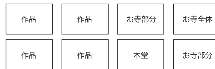
Light of Temple